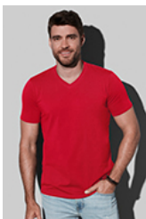
ST9610 Clive V-neck